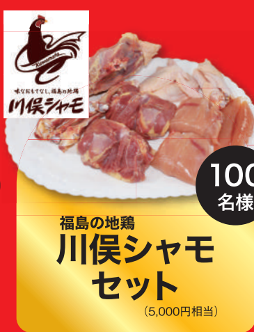
福島の地鶏 川俣シャモ セット (5,000円相当)