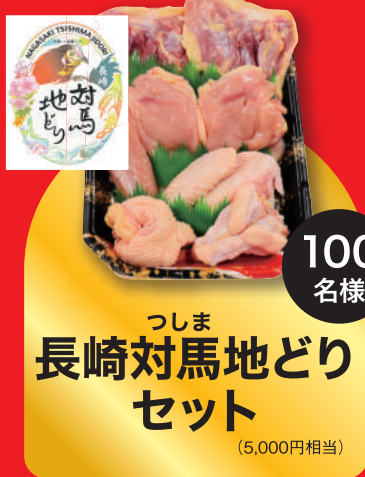
つしま 長崎対馬地どり セット (5,000円相当)