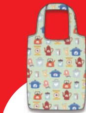
地鶏肉の当選者全員 (200名様)にもれなく 「鶏のエコバッグ」を プレゼントします!